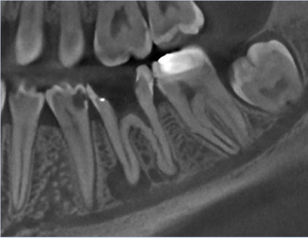
Abb. 3: Beispiel für die enge Lagebeziehung zwischen Entzündungsherd an der Wurzelspitze und den Unterkiefer-Gefühlsnerven