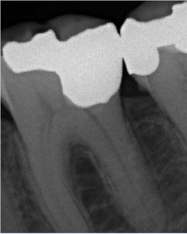
Abb. 1: Normaler Aspekt einer Zahnwurzel mit einem erkennbaren schmalen Spalt zwischen Zahn und Knochenfach.