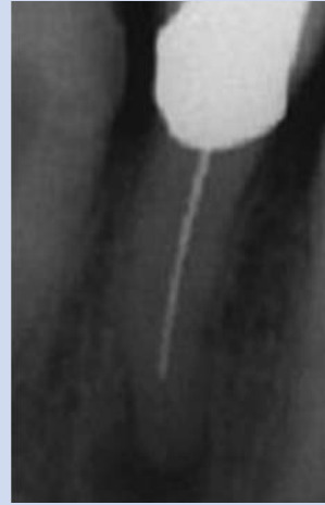
Abb. 2: Entzündung an der Wurzelspitze. Hier ist ein Entzündungs-herd entstanden, der sich im Röntgenbild als Knochendefekt dar- stellt.

ven Eingriffs deutlich, dass der Zahn nicht erhalten werden kann.